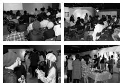
過去のイベント風景

第3部 20:10 - 21:10 ●みんなでトーク(お食事を楽しみながら参加者同士の交流会)